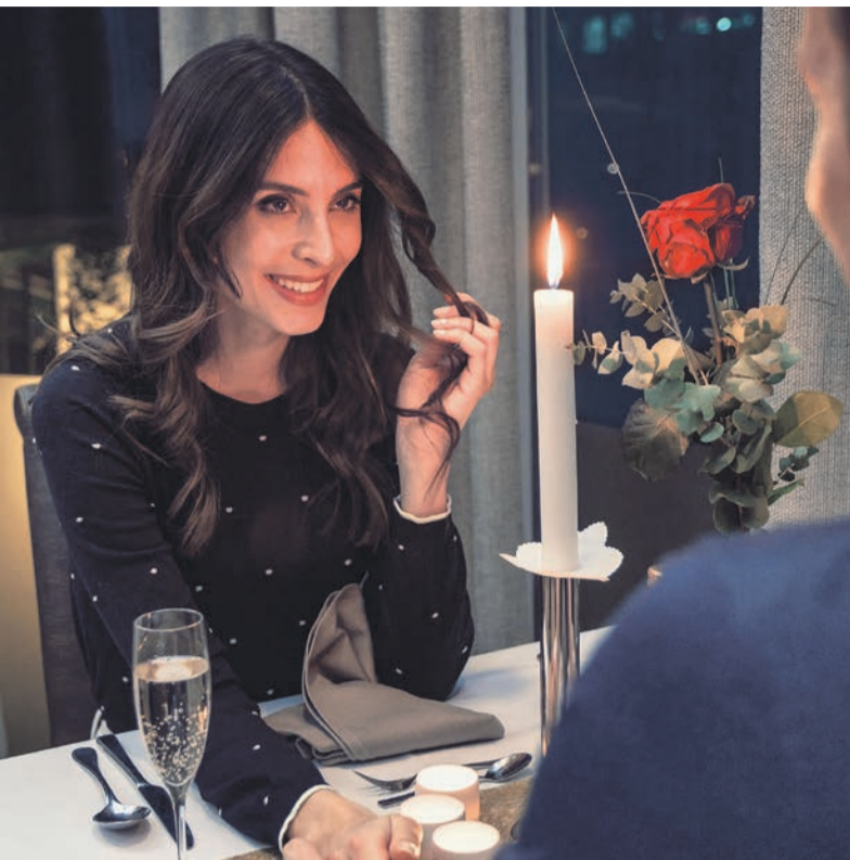
Erholende Auszeit zum Muttertag.

Der Muttertag hat in Deutschland über 100 Jahren als besonderer Anlass eine lange Tradition und wird seit lass genutzt, um Wertschätzung und