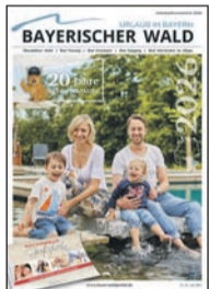
[TUH / 837]